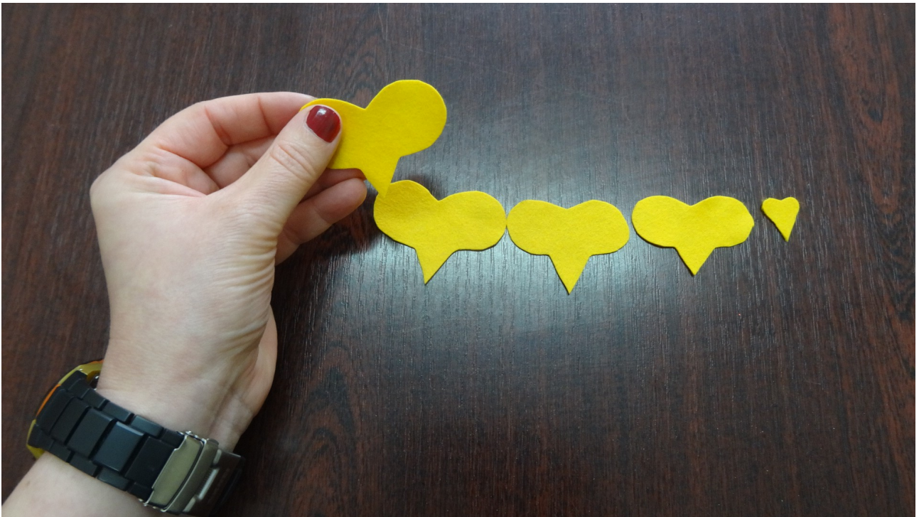
Krok 1 B