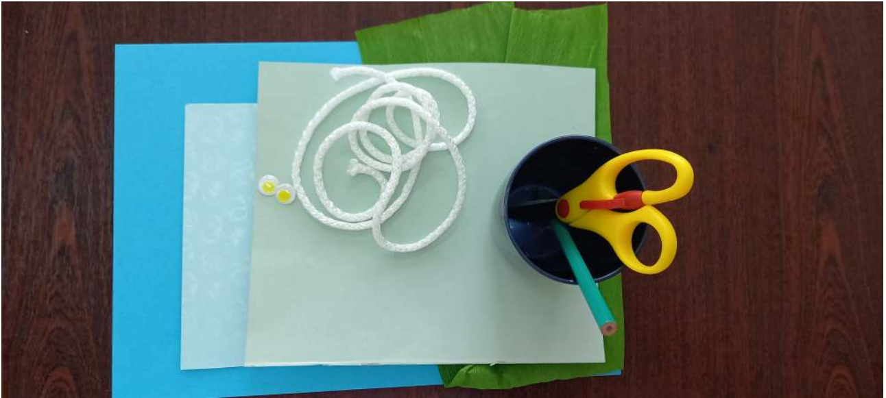
Krok 1. Wytnij trawę z zielonej bibuły.

Będą potrzebne materiały: niebieski papier formatu A 4 (tło), ścinki kolorowego i ozdobnego papieru, zielona bibuła, ołówek, nożyczki, klej, ruchome oczka, sznurek i czerwony mazak.