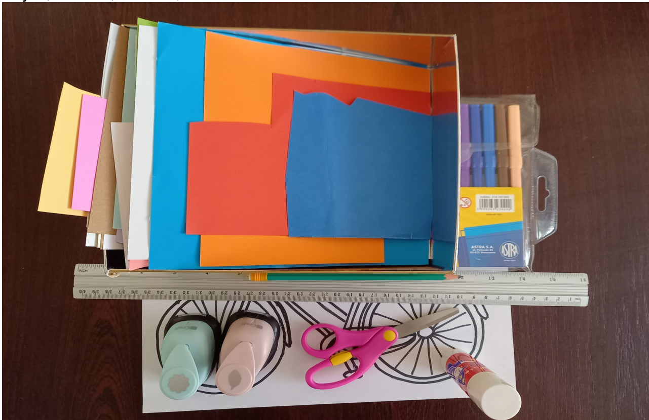
Krok 1. Pokoloruj mazakami rower.

Będą nam potrzebne materiały: ścinki kolorowego papieru, nożyczki, klej, linijka, ołówek, mazaki, dziurkacze ozdobne w kształcie lista i kwiatka.